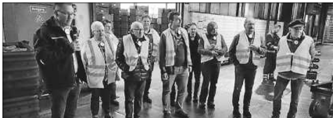
Teilnehmer der Werksbesichtigung

tag, 15. März das Hammerwerk Fridingen besichtigen konnte. Unter seiner sachkundigen Führung erhielten die Teilnehmer einen spannenden Einblick in die Produktion, bei einem rund 2-stündigen Rundgang durch das gesamte Werk.