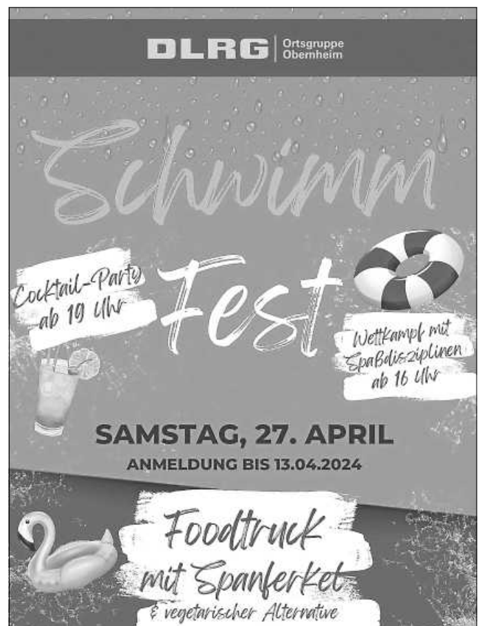
Plakat: OG Obernheim