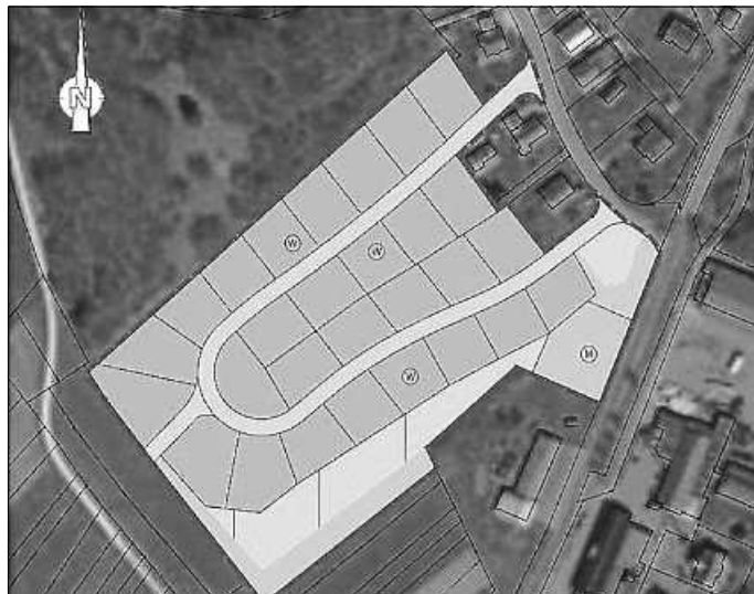
Abbildung 2: 1. Berichtigung des FNP