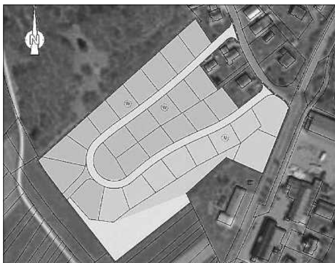
Abbildung 1: Ausschnitt aus dem rechtswirksamen FNP

Die Planunterlagen inklusive Begründung der 1. Berichtigung des Flächennutzungsplans werden im Zeitraum vom 22.04.2024 bis einschließlich 25.05.2024