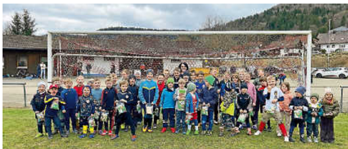
Osterevent Jugend TSV Abt. Fußball

Hierzu laden wir alle recht herzlich ein, unsere jüngsten Jugendspieler zu unterstützen. Fürs leibliche Wohl ist ebenfalls gesorgt. TSV Nusplingen Abt. Fußball