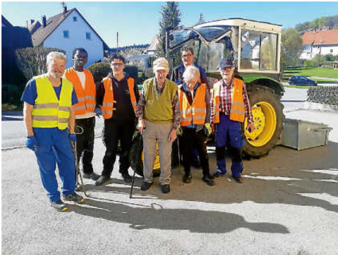
Eine der drei Arbeitsgruppen

Am vergangenen Samstag wurden vom MGV die über 500 Schächte der Gemeinde Oberheim geleert.