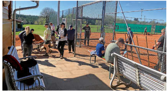
Bei der TGO wuselt es nur so von Helfer*innen.