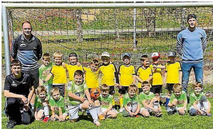
Bambini und F- Jugend Spieltag 25.04.26

Also willst auch du Teil des TSV Nusplingen sein, dann melde dich doch einfach, es sind alle herzlich willkommen!