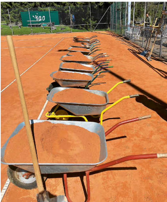
Schubkarre an Schubkarre. Pro Platz 28 Schubkarren Sand. Und der will von der Schaufel eingeworfen werden.

Ihr wart spitze! Stellt schon mal Schuhe und Schläger bereit. Bald geht es los. Die Arbeit hat sich gelohnt. Und die Verpflegung war mindestens so gut wie das Wetter.