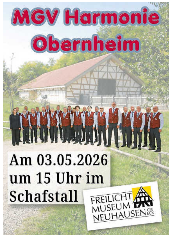
Sänger des MGV und Schafstall