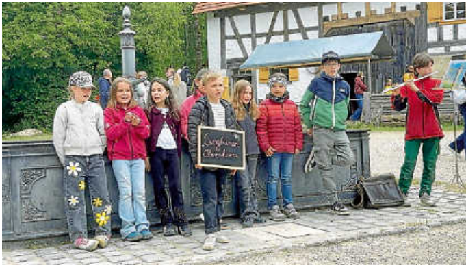
Am Brunnen bei der Schule