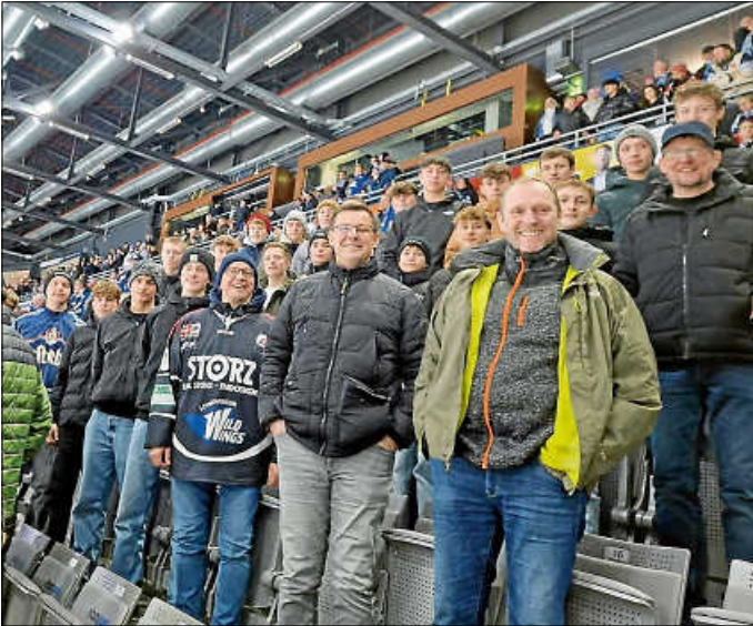
B Junioren bei den Wild Wings