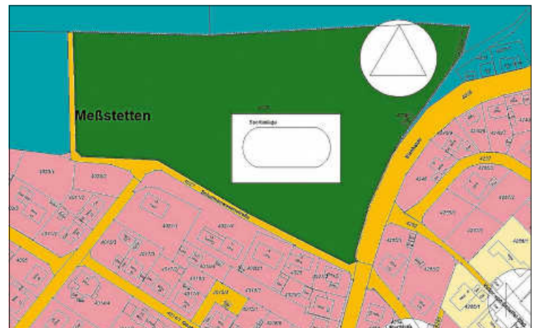
Betroffenes Flst. 4025, Meßstetten, Auszug aus dem rechtswirksamen Flächennutzungsplan

Anlass für die Änderung des Flächennutzungsplanes ist die geplante Aufstellung eines Bebauungsplans im Bereich der ehemaligen Sportanlage „Eichhalde“ auf dem Flst. 4025 in Meßstetten. Mit der Aufstellung des Bebauungsplans und der Änderung des Flächennutzungsplans in diesem Bereich sollen die planungsrechtlichen Voraussetzungen zur Schaffung von Wohnraum geschaffen werden.