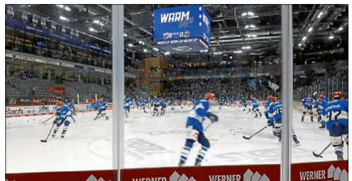
B Junioren bei den Wild Wings

Also Jungs weiter so angreifen und dranbleiben!