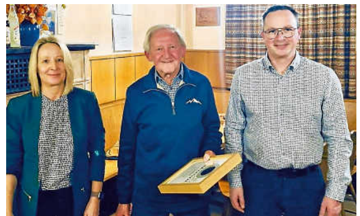
Ehrung für 70-jährige Mitgliedschaft